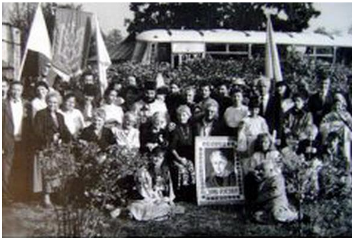
Софійн день. Олешня 1991 рік.

Синонім обов'язком вдячності було написання Юрієм Русовим нарисів про батьків: Олександра Олександровича та Софію Федорівну Русову. Нажаль, пересічному читачеві ці публікації недоступні, оскільки довгі роки через тавро «українська буржуазна націоналістка та емігрантка» і спадщина Русової, і згадки про її діяльність були під забороною.